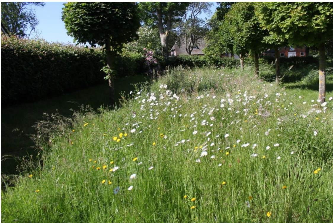
Abb. 3 Positives Beispiel eines mehrjährigen artenreichen Wiesenstreifens in Bordelum.