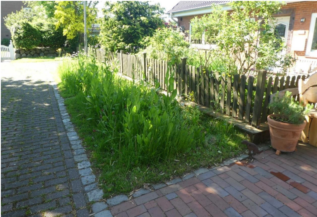
Abb. 2 Positives Beispiel eines insektenfreundlich gestalteten Vorgartens im Projektgebiet. (Foto Jan Blew).